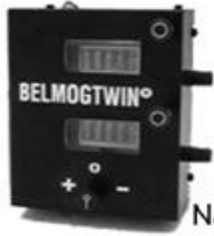
Belmogtwin MK II BELMOG New Belmogtwin